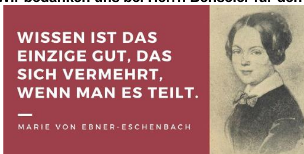
Mährisch-österreichische Schriftstellerin (*1830 – †1916)